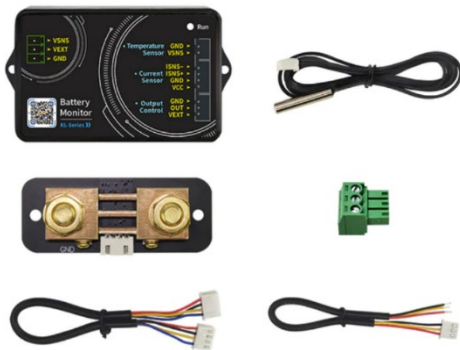
Référence I INDKL110F

Indicateur de capacité (coulombmètre) conçue pour mesurer divers paramètres tels que la tension, le courant, la puissance, la capacité de charge et décharge, les wattheures et le temps.