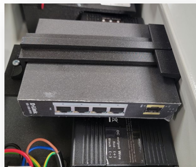
Support pour injecteur POE

Un support est prévu pour placer un injecteur POE 4 sorties pour l'alimentation des caméras.