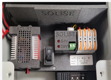
Bornier de sortie

Deux sorties sur bornier à clip 4mm 2 sont prévues pour alimenter votre installation.